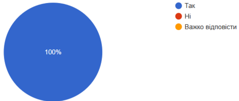
Рис. 1. Результати відповідей на запитання «Чи вважаєте Ви, що тварини можуть позитивно впливати під час війни»

Респондентам було запропоновано описати особливості їхньої післявоєнної адаптації. Отримані відповіді вирізняються різноманітністю та відображають індивідуальний характер переживання цього процесу. Частина ветеранів вказує на особистісні зміни («став більш дорослим, у переносному значенні»), інші наголошують на складності рефлексії власного досвіду («важко відповісти», «я до цих пір ще там»). Водночас у відповідях простежується потреба у підтримці з боку близького соціального оточення та збереженні особистого простору («сім'я, друзі, не потрібно надмірної уваги, інколи потрібно побути одному»). Окремі відповіді ілюструють індивідуальні стратегії подолання труднощів адаптації, зокрема зміну способу життя та середовища проживання.