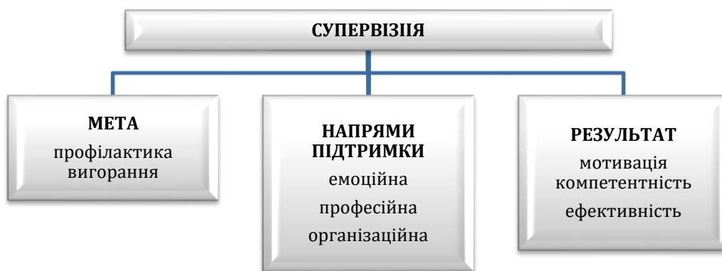
Схема 1. Складено авторами.