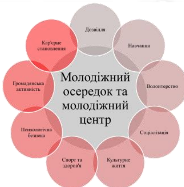
Рис. 2. Сфери впливу молодіжного осередка та молодіжного центру.

Відповідно основних сфер молодіжного центру та з метою реалізації всіх напрямків впливу автори проекту Молодіжний осередок «Молодіжна країна» створили 3 основні зони (Див. Рис. 3.):