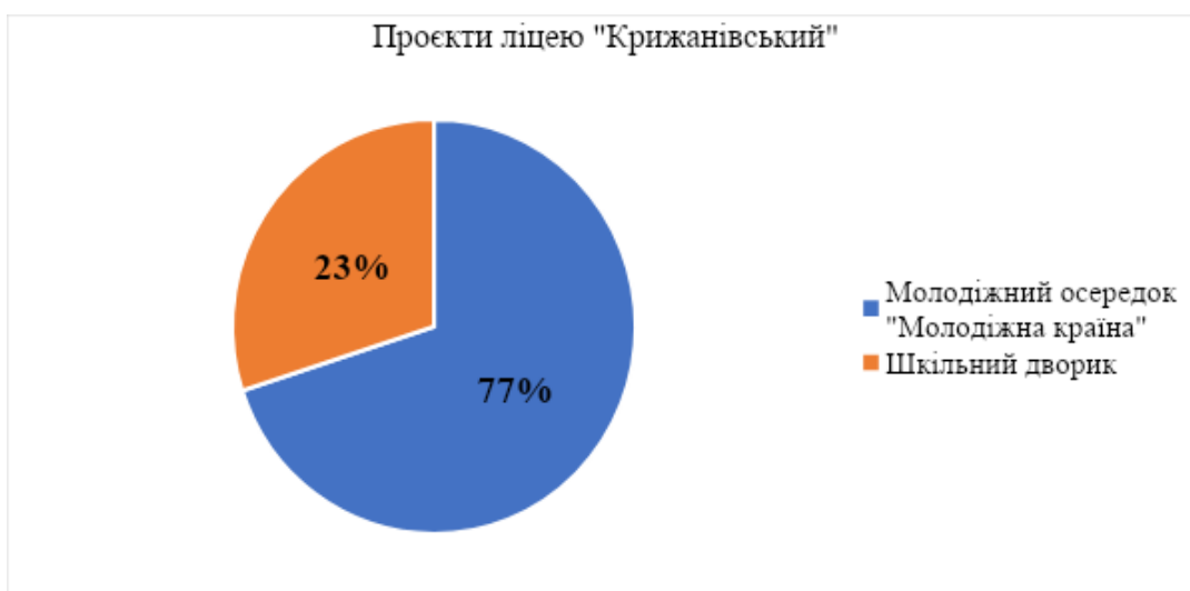
Рис.1. Результати голосування учнівських проєктів в межах «Шкільний громадський бюджет».

Нами представлено діаграму результатів учнівського голосування (Див. Рис. 1.). Команди учнів ліцею «Крижанівський» в межах програми «Шкільний громадський бюджет» створили 2 проєкти, а саме: Молодіжний осередок «Молодіжна країна» та «Шкільний дворик» [4].