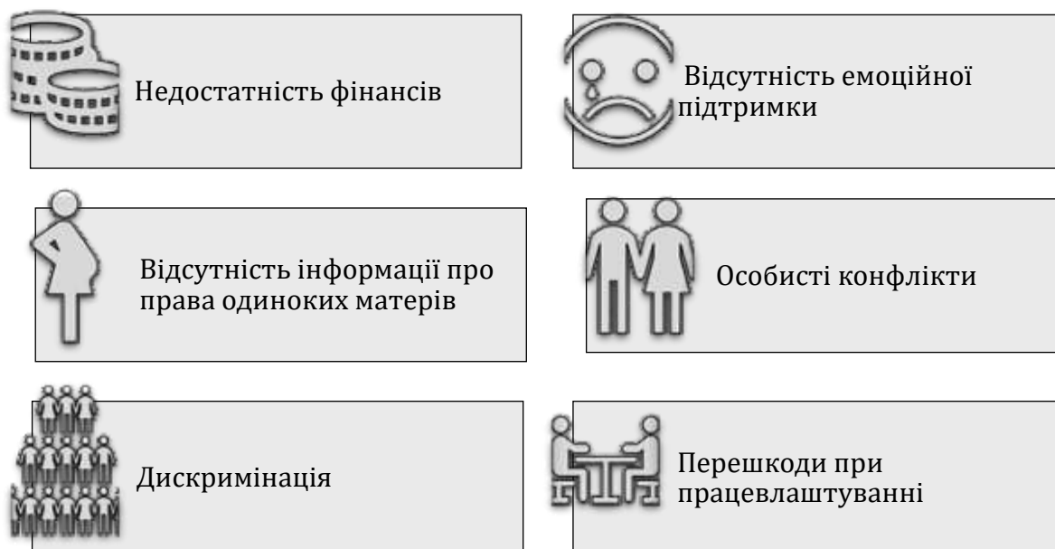
Рис. 3. Основні проблеми одиноких матерів в Україні

На третьому етапі емпіричного дослідження було проведено опитування щодо виявлення основних проблем та потреб одиноких матерів. Для проведення дослідження нами було розроблено авторський опитувальник «Виявлення проблем та потреб одиноких матерів в умовах воєнного часу». З отриманих даних можемо зазначити, що найчастіше жінки відзначали фінансові проблеми та перешкоди при працевлаштуванні. Ті жінки які вказували на відсутність емоційної підтримки також зазначали і особисті конфлікти. Відсутність інформації про права одиноких матерів зазначили майже всі учасниці дослідження та вагомий відсоток жінок вказали на складнощі при взаємодії із соціальними службами. Найактуальніші загальні проблеми, що зазначені респондентками в ході дослідження відображено на рис. 3.