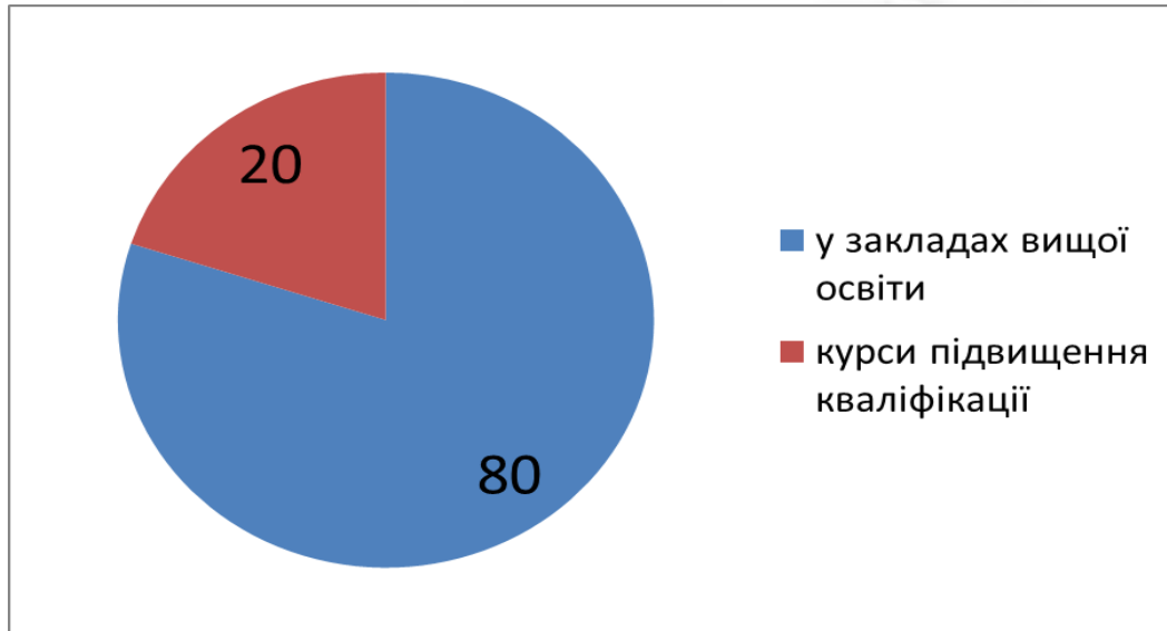
Рис. 1. Відповіді респондентів стосовно професійної підготовки молодіжних працівників

На запитання «Чи відчутний соціальний ефект у Вашій громаді від діяльності молодіжних працівників, молодіжних центрів?», відповіді розподілилися наступним чином: 50 % – відчутний, 25 % – не відчутний, 25 % – не змогли визначитися (Рис. 2).