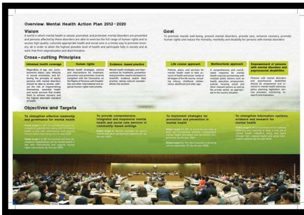
Рис 2. Комплексний план дій ВООЗ у галузі психічного здоров'я на 2013–2020 рр.

Цей план дій наголошує також на важливості захисту прав людини, звертає увагу на важливість зміцнення громадянського суспільства та порушує питання медичної допомоги, яка повинна відбуватися на первинному рівні» [3].