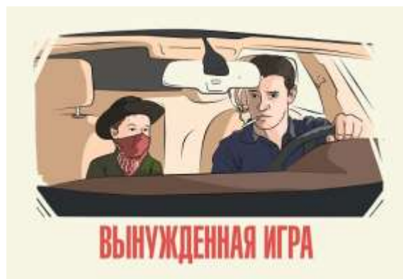
Рис 5. Друкована реклама «Вынужденная игра»

Соціальна реклама може не тільки безпосередньо впливати на глядача та прищеплювати йому певні цінності, інформувати чи попереджувати. Вона може також розвивати, поширювати інформацію про соціальні проєкти, які у свою чергу, мають вузько-спрямований спектр допомоги певним групам населення та, відповідно, покращують здоровий клімат серед населення. Серед успішних реалізованих соціальних проєктів України можна назвати такі: