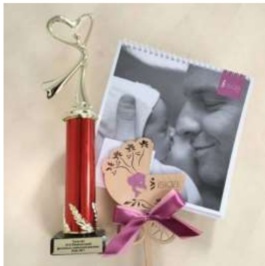
Рис 3. Візуалізація проєкту «Відповідальне батьківство»

1. Команда «GresTodorchuk PR» разом із клінікою ISIDA створили комплексний соціально-комунікаційний проєкт під назвою «Відповідальне батьківство» і отримали Гран-прі на 10-му Національному фестивалі соціальної реклами у 2017 році [5].